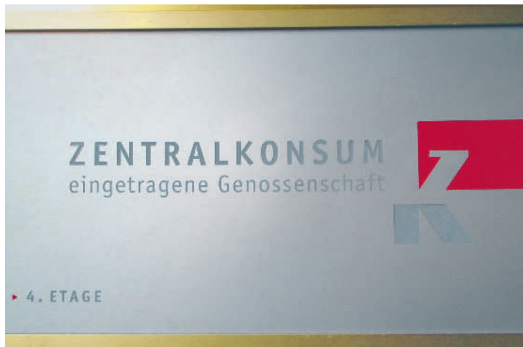
Das Logo der Zentralkonsum eG erinnert dezent an ihre Wurzeln in der DDR.