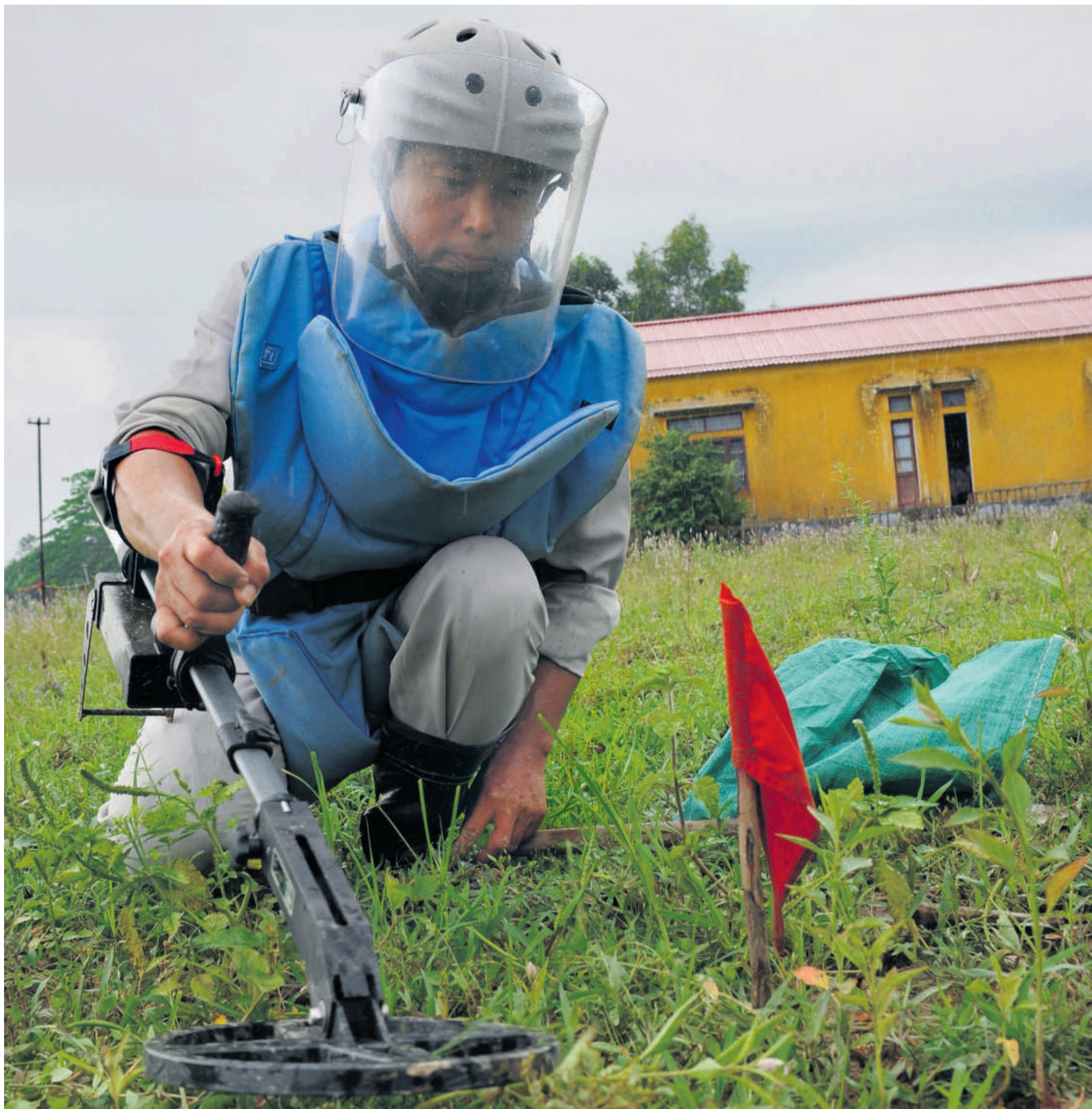
Der SODI e.V. macht nicht allein auf das Problem der Verminumg aufmerksam. SODI hat auch eine Unterschriftenkampagne zur Unterstützung der vietnamesischen Agent Orange Opfer gestartet.