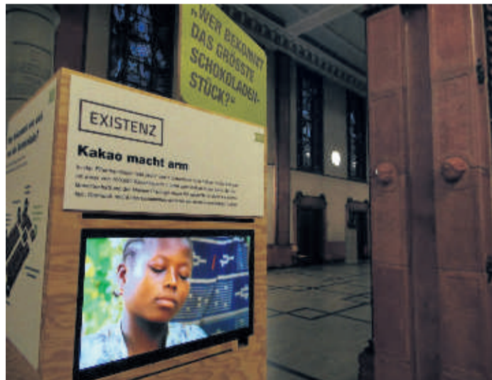
Süß & bitter. Schokolade hat ihre Schattenseiten.