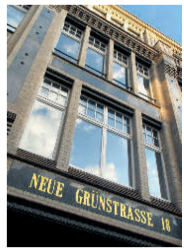
Zentralkonsum eG sitzt im 4. Stock

Letztlich ist dieser Erfolg auch eine Bestätigung für die vielen Einzelmitglieder, die eine traditionsreiche Idee vom solidarischen Wirtschaften unterstützen. Bei der Zentralkonsum eG, beziehungsweise ihren Mitgliedsunternehmen, sind es 212.000 Menschen die Genossenschaftsanteile halten. Sie fühlen sich einem großen Erbe verpflichtet.