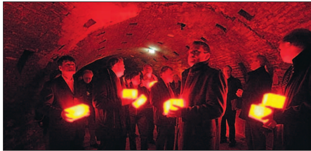
Mit Leuchtziegeln ist eine Gruppe unterwegs durch den Ringofen des Zieglereimuseums

Entdeckungen für das winterliche Brandenburg