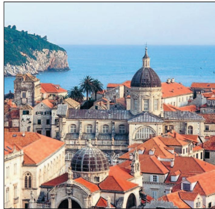
Zwischen Weltkulturerbe und Badespaß Dubrovnik, die Perle an der Adria. Wasserfälle inmitten des Krka Nationalparks (unten)

Noch imposanter wirkt die Kulisse vom Wasser aus. Zumal die Fahrt zu einer der vielen vorgelagerten Inseln Dalmatiens ein absolutes Muss