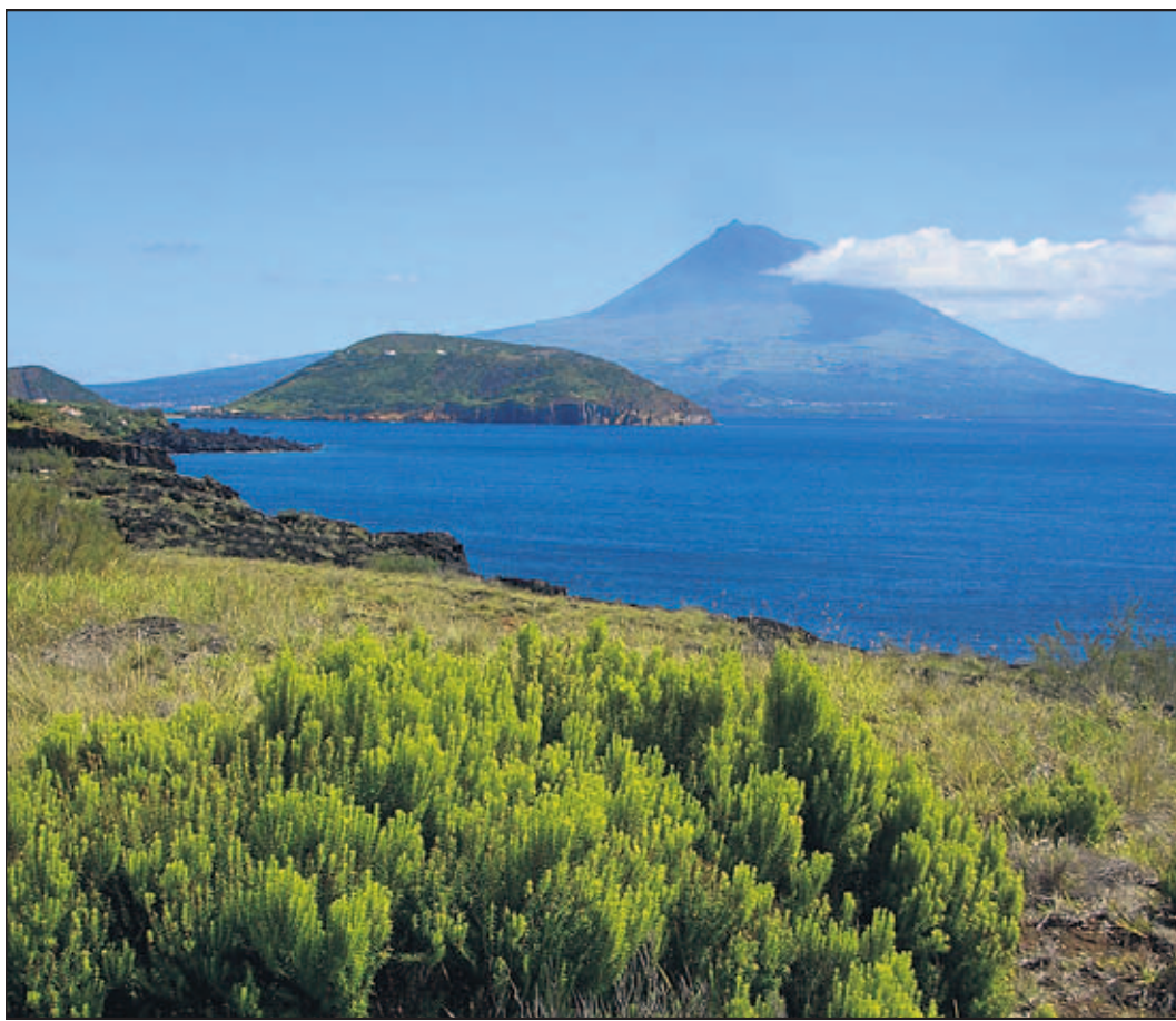
Blick auf den Vulkan Pico

Gut 1500 Kilometer von Lissabon entfernt erkunden wir mit ihm São Miguel: das größte Eiland im Archipel der Azoren, deren Gesamtfläche immerhin die des kleinen EU-Stadtstaats Luxemburg er-