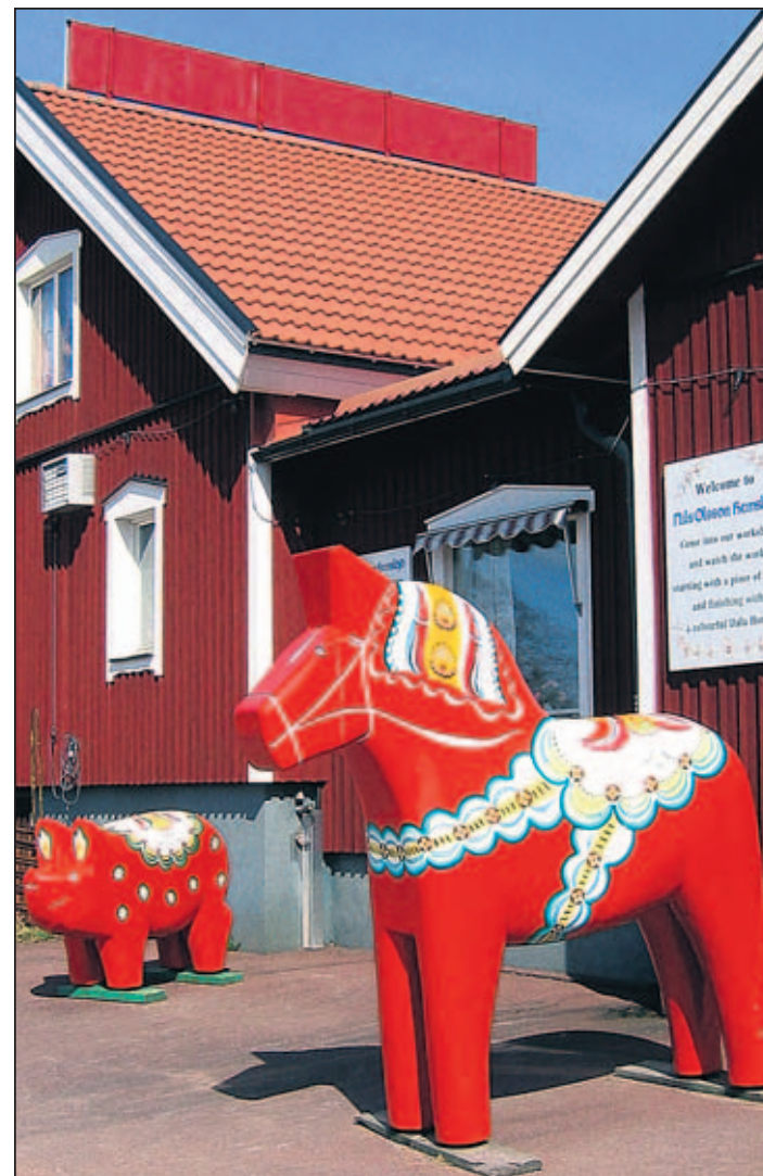
Im Kupferbergbau-Museum (oben) und eines der bekannten Dalapferde – allerdings deutlich größer als gewohnt

Informationen: Im Internet: visitsweden.com Reiseführer: DuMont Richtig reisen: Schweden von Petra Jüling, DuMont Reiseverlag, 2. Auflage 2008, 416 S., 22,95 Euro Zum Lesen: Tilman Bünz: Wer die Kälte liebt. Skandinavien für Anfänger. btb-Taschenbuch, Broschur, 336 Seiten, 8 Euro Alfred Andersch: Wanderungen im Norden. Diogenes. Antiquarisch.