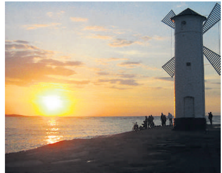
Sonnenuntergang in Swinemünde

Ausgewählte Kurbäder mit reiner Luft und natürlichen Heilquellen, das garantiert Erholung pur. Schon ab 145 Euro kann man im Monat März eine Kurwoche mit Vollpension in Swinemünde (Swinoujście, polnische Ostsee) genießen. Die Angebote von DESLA Touristik zeichnen sich stets durch ein sehr günstiges Preis-/Leistungsverhältnis aus. Möglich ist das, weil DESLA Touristik kein kos-