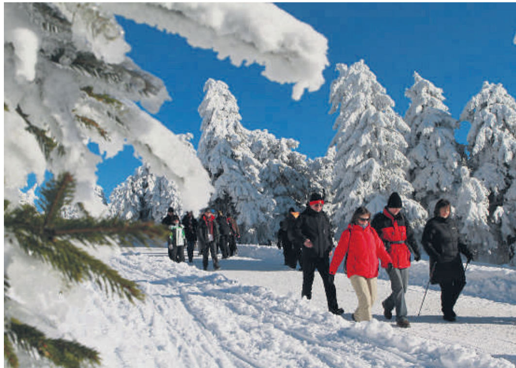
Wanderer auf der Brockenstraße

Osterode am Harz – hier liegen Sie richtig!