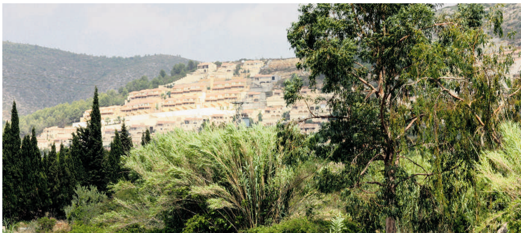
Neben der Berglandschaft lohnt auch ein Ausflug in die Bodega in Jalón.

Tatsächlich vermag man hier Trödel, Nonsense und allerhand Nippes zu erwerben. Vor allem aber durchaus ansehnliche Antikware wie Spiegel, Sessel, Kommoden,