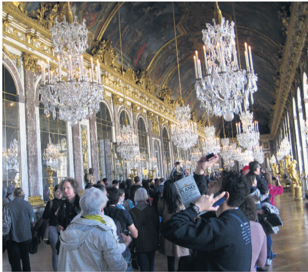
Besucher aus aller Welt drängen sich im Spiegelsaal von Versailles.

Die Anfänge gehen zurück bis ins 15. Jahrhundert, als die im Pariser Stadtschloss residierenden französischen Könige damit begannen, Kunstgegenstände zusammenzutragen. Was damals nur wenige sahen, wurde im Zuge der Französischen Revolution schließlich der allgemeinen Öffentlichkeit zugänglich. »Markenzeichen« des riesigen Museums ist heute weniger die erhabene Fassade des alten Schlosses, sondern die futuristische Glaspylone im Innenhof. Tag für Tag bilden sich hier am Haupteingang lange Schlangen. Auf Rolltreppen geht es hinunter in den zentralen Saal mit den Kassen, Garderoben, Shops. Dann die Qual der Wahl: Welche der Ausstellungen zuerst besuchen, für wie viele Säle reicht die Zeit? Einen Tag sollte man schon einplanen,