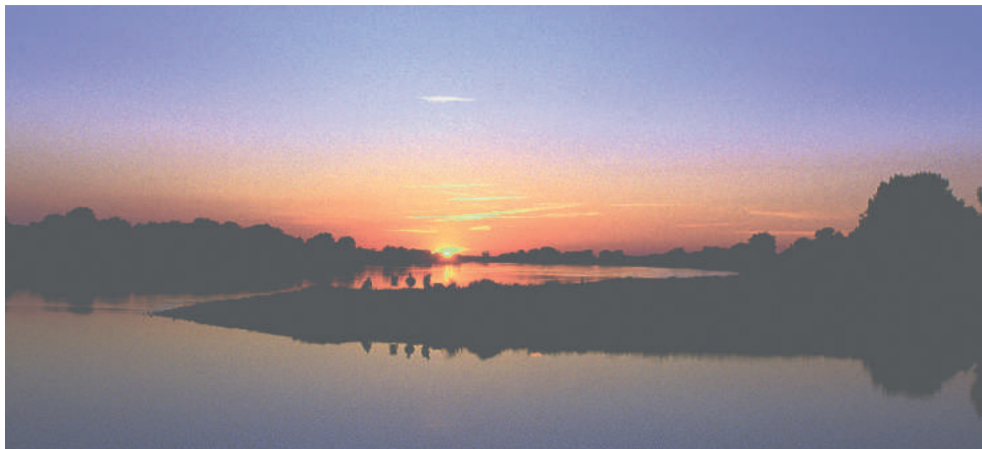
Sonnenuntergang am Elbeufer im Biosphärenreservat

1935 pflanzte ein Hamburger Obstbauer auf einem Kahlschlag die ersten Apfelbäume - heute ist das Elbetal geprägt von einer der größten Obstplantagen Deutschlands.