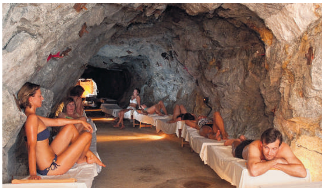
Im Herzen des Radhausberges: Gute Bedingungen für die Radonwärmetherapie

Immer mehr Menschen nutzen ihren Urlaub, um etwas für die Gesundheit zu tun. Bei mehr als der Hälfte der Generation 60+ steht dieser Aspekt bei ihrer Reiseplanung sogar ganz oben. Viele wünschen sich jedoch nicht nur Wellness- und Kurprogramme zur Prävention. Besonders gefragt: Angebote, um gesundheitliche Probleme wie beispielsweise chronische Schmerzen, Erkrankungen der Atemwege oder Hautkrankheiten gezielt zu bekämpfen. Mit einer Radonwärmetherapie im Gasteiner Heilstollen lässt sich dieses Ziel sogar mit einem attraktiven Natur- und Erholungswert verbinden.