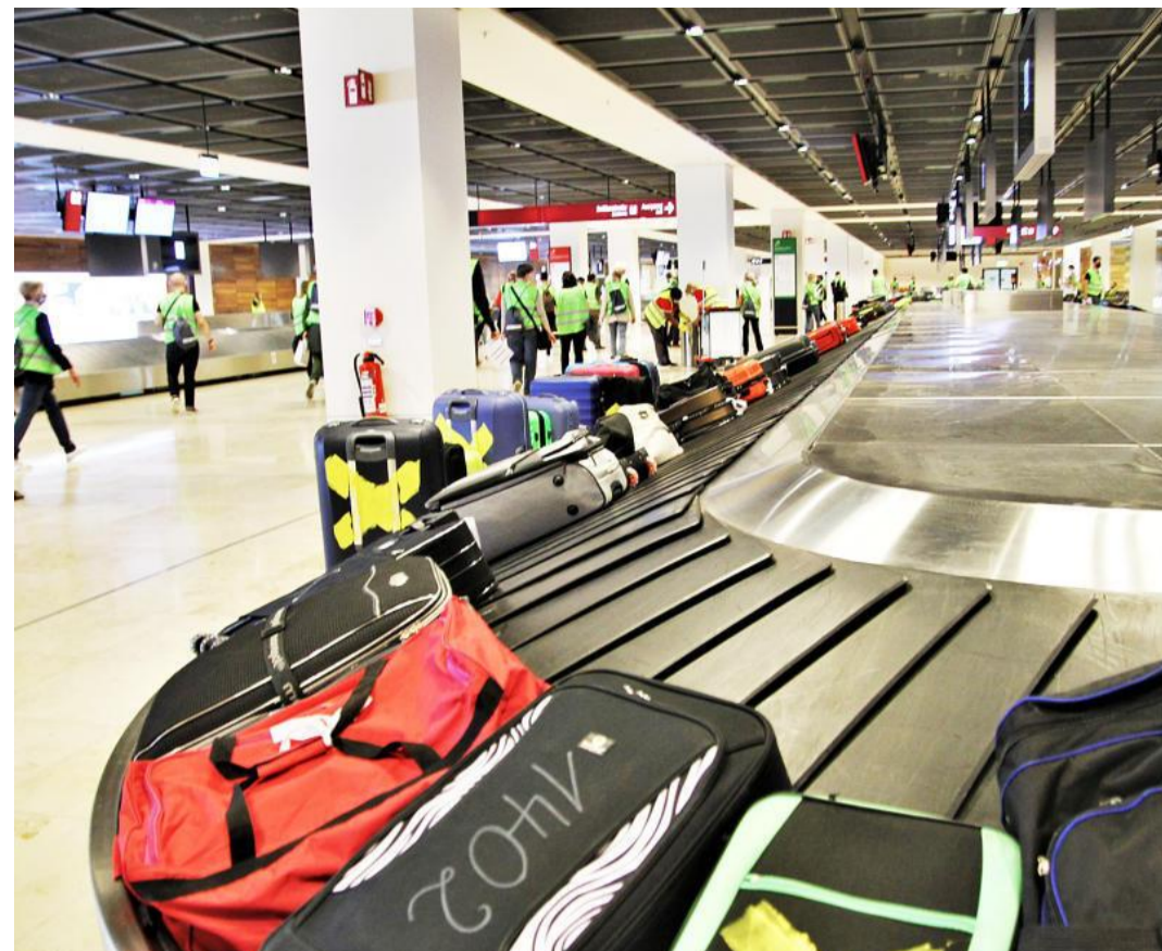
Die Gepäckbänder rollen schon, hoffentlich funktioniert ab Ende Oktober auch der Rest des Flughafens so gut.

Am 31. Oktober soll der BER endlich an den Start gehen – derzeit wird er von Freiwilligen auf Herz und Nieren getestet