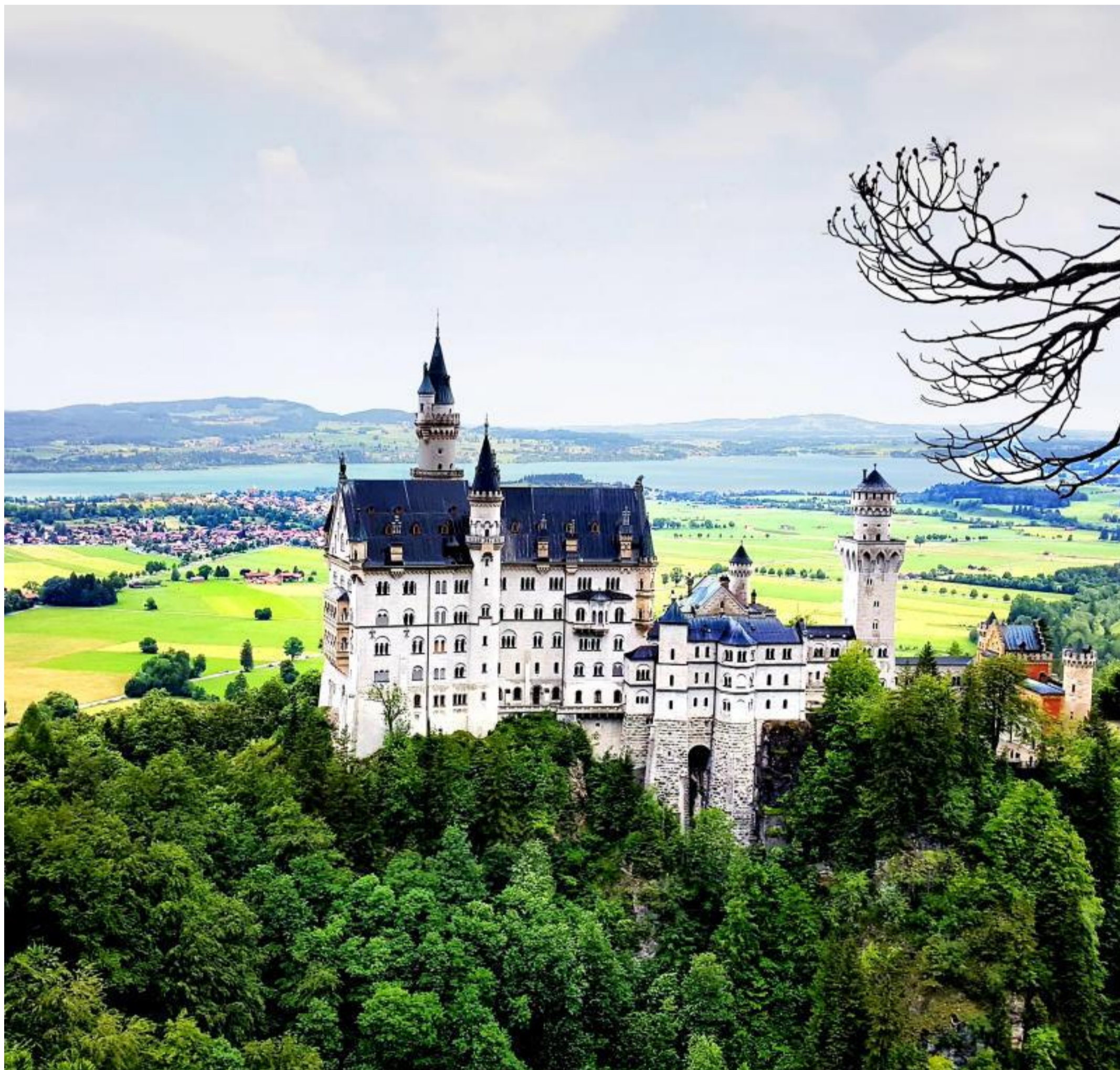
Schloss Neuschwanstein aus der Vogelperspektive – auf der Himmelsstürmertour der Wandertilogie Allgäu liegt einem das bayerische Märchenschloss Ludwig II. zu Füßen (S. 3)