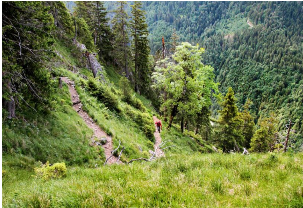
Aufwärts, immer aufwärts auf der »Himmelsstürmeroute«