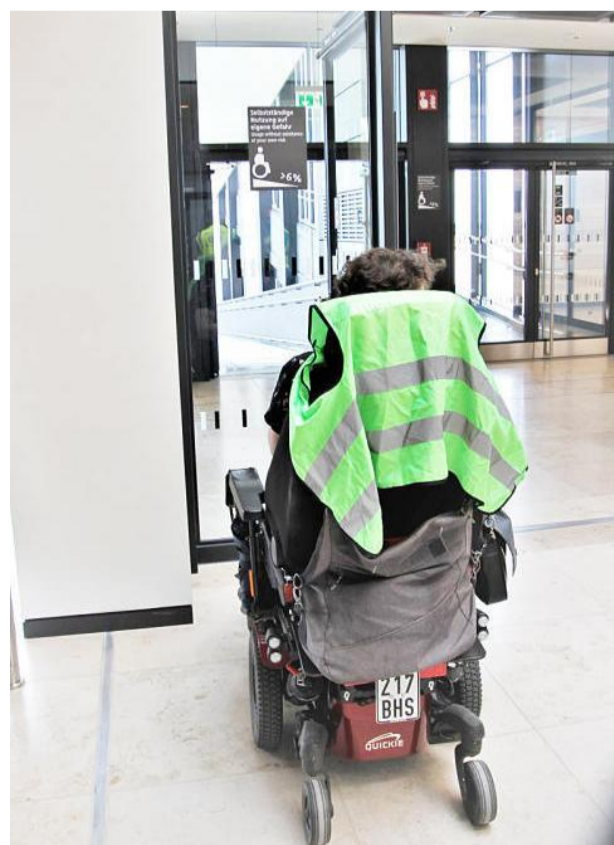
Verunsichert schaut die Rollifahrerin auf das Gefälle.

Noch bleiben knapp zwei Monate, um alle Fehler zu finden und zu beseitigen, damit der Berlin-Brandenburger Flughafen BER am 31. Oktober ohne Pleiten, Pech und Pannen an den Start gehen kann. Dann endlich wird Berlin einen Flughafen haben, der sich international auch sehen lassen kann!