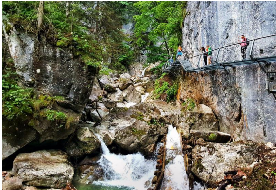
Die Pöllatschlucht an der »Wasserläuferroute« bietet ein imposantes Naturschauspiel