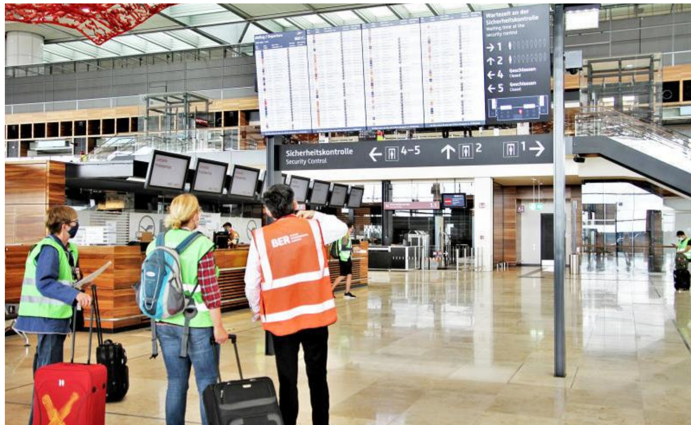
Die Anzeigetafeln geben nicht nur über die Flüge Auskunft, sondern auch über den Standort und den Andrang beim Security Check.