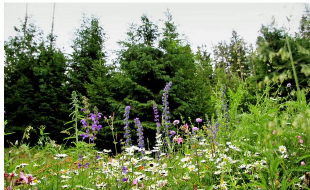
Das kleine Glück am Wegsrand: bunte Wiesenblumen, wo einst totes Holz lag.

Die Wandertrilogie Allgäu zeichnet sich auch dadurch aus, dass die gesamte Region in verschiedene Erlebnisräume unterteilt wird. Denn während des Wanderns soll nicht nur die Natur und Landschaft, sondern auch die Kultur und Geschichte der Region mithilfe von Helden und Wahrzeichen erlebbar gemacht werden. Erzählt wird auf den Routen und Etappen der Wandertrilogie die Geschichte von Persönlichkeiten, die das Allgäu prägten, wie König Ludwig II., Pfarrer Sebastian Kneipp oder der Agrarreformer Carl Hirnbein.