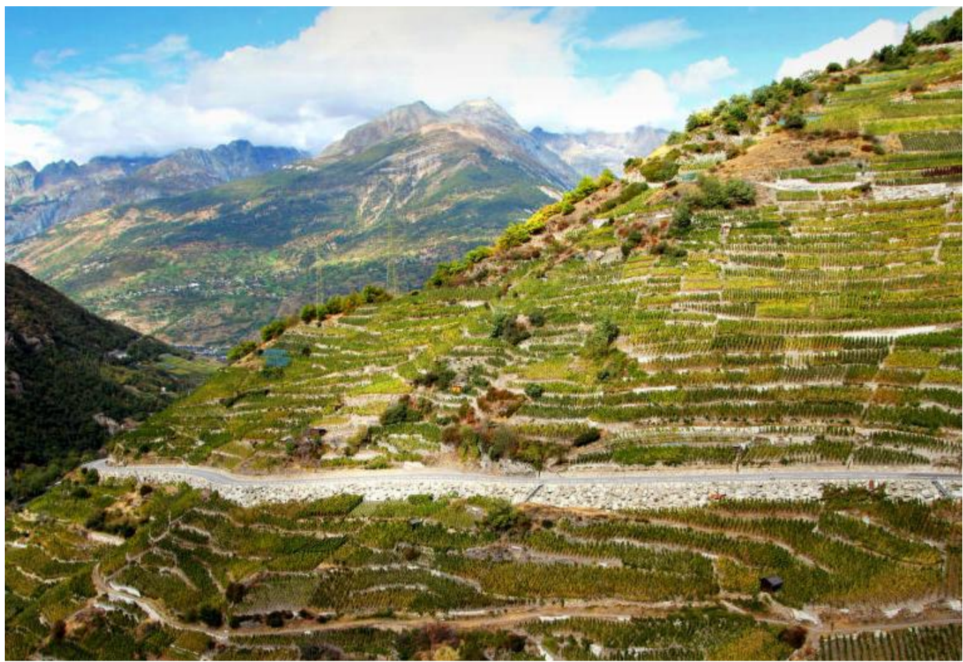
Bei Visperterminen gibt es nicht nur den höchsten Weinberg Europas, sondern hier wächst auch eine besondere Rarität.

Genießen kann man die Weine überall im Kanton, doch es gibt dort ein paar Orte, die dafür ein ganz besonderes Vergnügen versprechen. Einer ist der am 1. November 2018 eröffnete erste Weinpark des Wallis, »Les Celliers de Sion«. Direkt an den Rebhängen zwischen Sion und St-Léonard gelegen, besticht der fu-